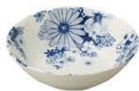
002575 4.5寸小鉢 Φ14XH4.1cm 189g