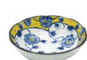
002278 4.5寸小鉢 Φ13.9XH4.1cm 180g