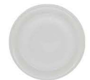
007171 7 1/2ケーキ Φ19.5XH2cm 267g