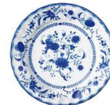
010609 9吋ミート φ23.4×H2.5cm 480g