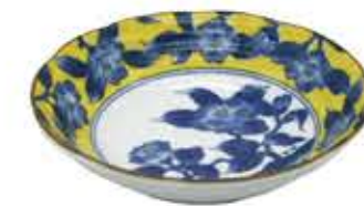
006454 5.5寸浅鉢 Φ16.5XH4cm 276g