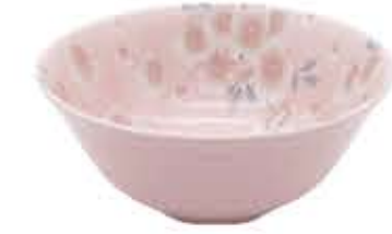
004075 4.8寸多用井 Φ15.2XH6.7cm 290g