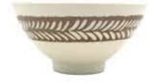
012850 大平 Φ12.7XH6.4cm 171g