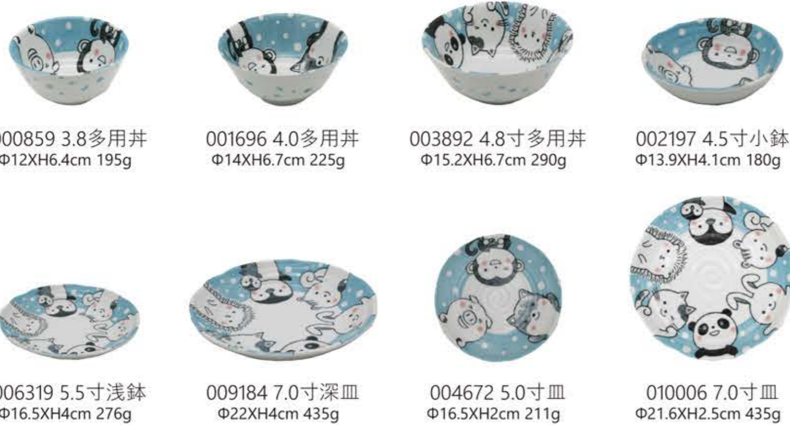
000859 3.8多用井 φ12XH6.4cm 195g