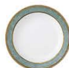
003244 6吋パン皿 Φ16XH2cm 210g