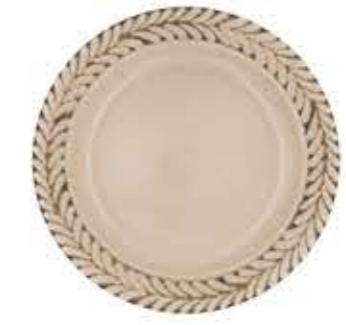
012641 7 1/2ケーキ Φ19.6XH2.2cm 294g