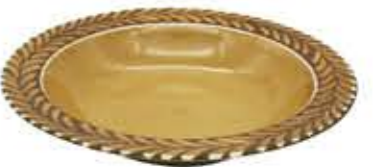
012145 8吋スープ Φ21XH4.2cm 364g