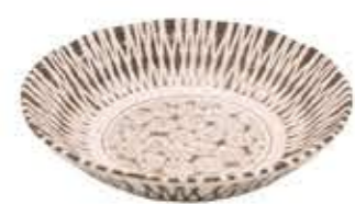
012789 5.5寸浅鉢 Φ16.5XH4cm 276g