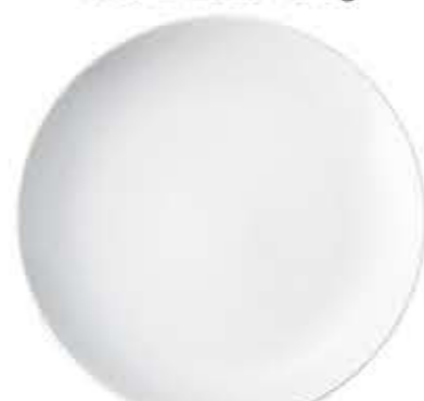
000712 10 1/4メタ皿 Φ25.7XH3.3cm 680g