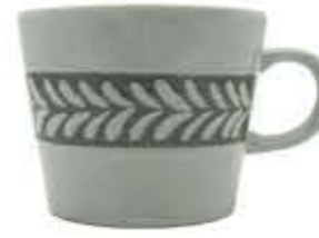
012003 切立マグ Φ10.5XH8.8cm 324g 370cc