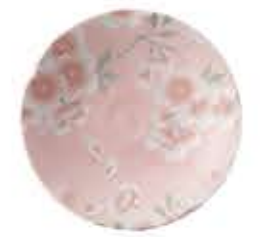
001381 4.0寸皿 Φ13XH2cm 128g