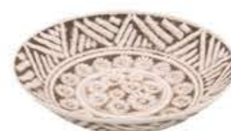
012785 5.5寸浅鉢 Φ16.5XH4cm 276g