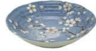
006535 5.5寸浅鉢 Φ16.5XH4cm 276g