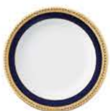
012037 6吋パン皿 Φ16XH2cm 210g