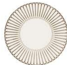
013052 5.0寸皿 Φ16.5XH2.3cm 198g