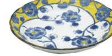
009397 7.0寸深皿 Φ22XH4cm 435g