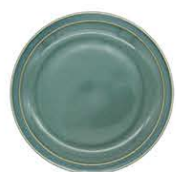
010372 7.0寸皿 Φ22.5XH2.4cm 416g