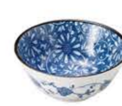
001051 3.8多用井 Φ12XH6.4cm 195g