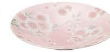
009901 7.0寸深皿 Φ22.3XH4cm 450g