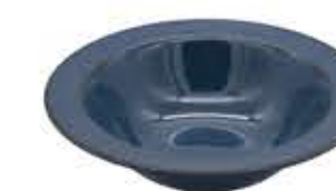
012847 6 1/2オートミル Φ17.2XH5.4cm 269g