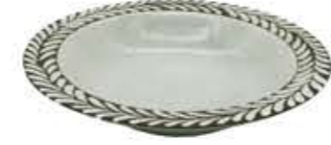
007603 8吋スープ Φ21XH4.2cm 364g