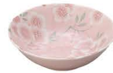
005932 5.5寸鉢 Φ17XH5cm 285g