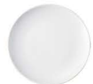
007291 7 3/4メタ皿 Φ19.5XH2.2cm 313g