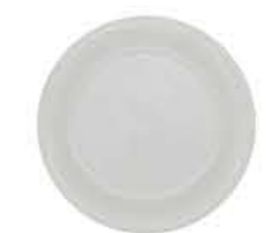
003571 6吋パン皿 Φ16.6XH1.8cm 187g