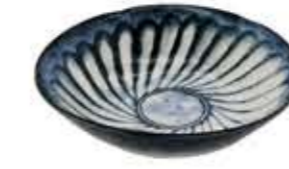
002581 4.5寸小鉢 Φ14XH4.1cm 189g