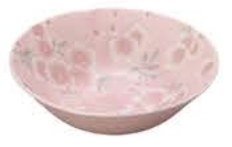
002623 4.5寸小鉢 Φ14XH4.1cm 189g