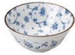
001048 3.8多用井 Φ12XH6.4cm 195g