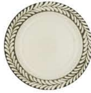
006925 7 1/2ケーキ Φ19.6XH2.2cm 294g