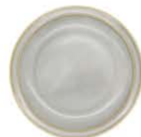
012391 5.0寸皿 Φ16.4XH2.1cm 174g