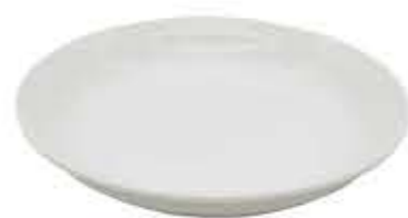
008758 7.0寸深皿 Φ22.4XH4cm 420g