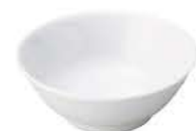
000292 6寸高台井 18.3XH6.9cm 486g