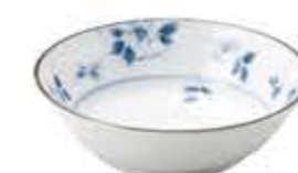
002062 4.5小鉢 φ13.4×H4.2cm 144g