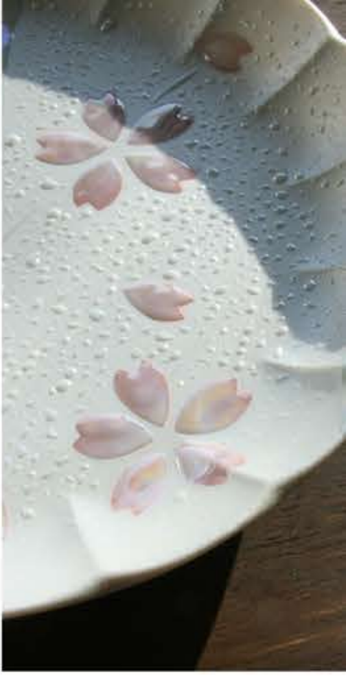
010210 7.0寸皿 φ21.1×H3.0cm 460g