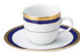
000406 CR碗 Φ7.5XH6.7cm 150g 170cc 000490 アーミー受皿 Φ15.4XH1.8cm 170g