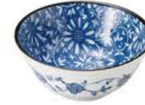
001867 4.0多用井 Φ14XH6.7cm 225g