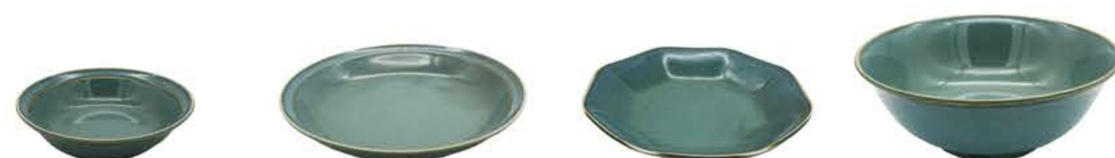
002782 4.5寸小鉢 Φ13.7XH3.55cm 151g