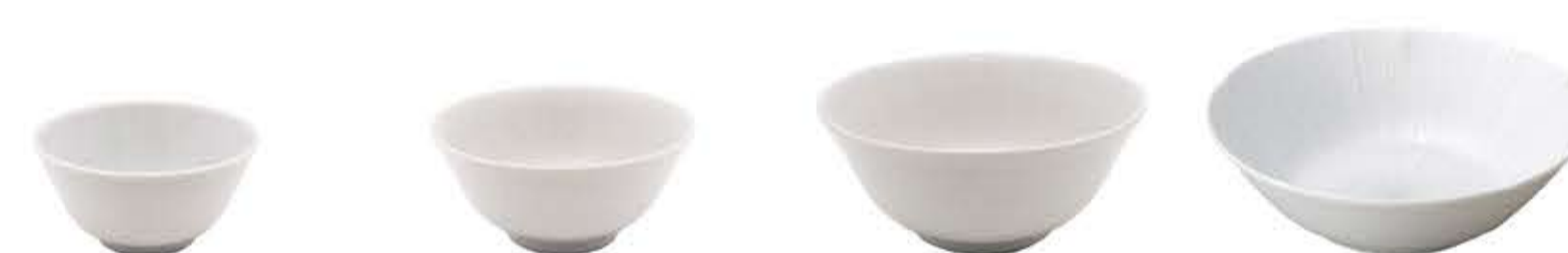
012814 3.8多用井 Φ12XH6.4cm 195g 001906 4.0多用井 Φ14XH6.7cm 225g 004057 4.8寸多用井 Φ15.2XH6.7cm 290g 007948 7.0寸鉢 Φ21XH6.2cm 440g