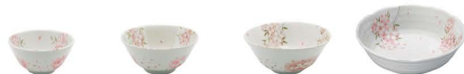
000916 3.8多用井 Φ12XH6.4cm 195g 001726 4.0多用井 Φ14XH6.7cm 225g 003940 4.8寸多用井 Φ15.2XH6.7cm 290g 007798 7.0寸鉢 Φ21.6XH6.5cm 516g