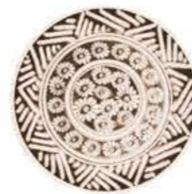
012784 5.0寸皿 Φ16.5XH2cm 211g