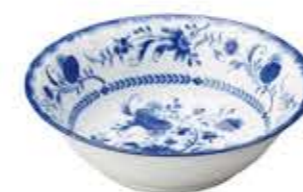
005206 6 1/2オトミル φ16.6×H5cm 263g