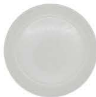
006955 6.5寸皿 Φ19.8XH3.2cm 308g