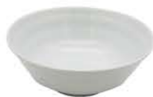
004243 5.3寸井 Φ16.2XH6.5cm 237g