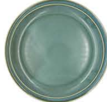
012072 8.0寸皿 Φ25.4XH3cm 575g