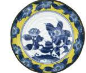
004780 5.0寸皿 Φ16.5XH2cm 211g