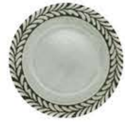
003331 6吋パン皿 Φ16XH2cm 210g