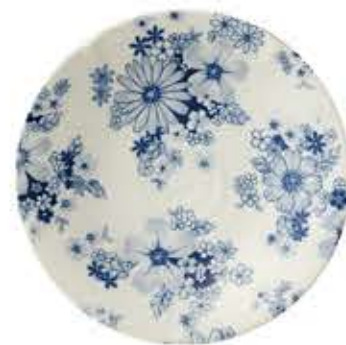
010297 7.0寸皿 Φ22XH2.7cm 398g