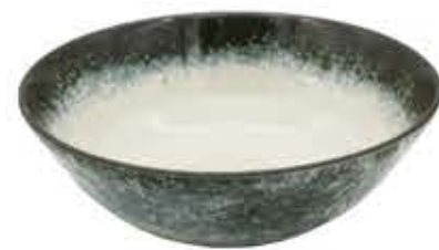
000244 6.8寸麵鉢 Φ21XH7.8cm 531g