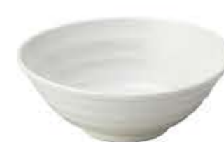
000154 6.8寸麵鉢 Φ21XH7.8cm 531g