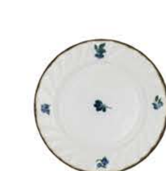
012103 7 1/2ケーキ Φ19.5XH2cm 275g