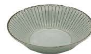
013049 5.5寸鉢 Φ17XH5cm 285g