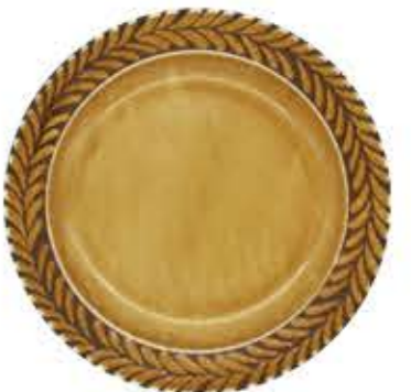
012146 9吋ミート Φ23.7XH2.8cm 515g