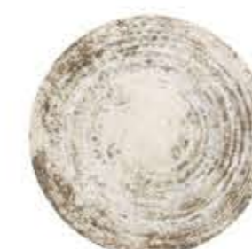
013072 5寸皿 Φ17XH2cm 145g