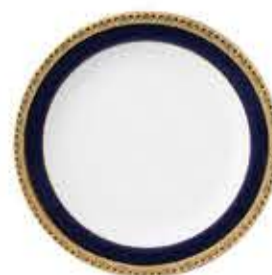
012035 7 1/2ケーキ Φ19.6XH2.2cm 294g