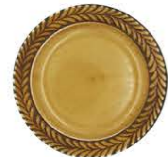
012144 7 1/2ケーキ Φ19.6XH2.2cm 294g