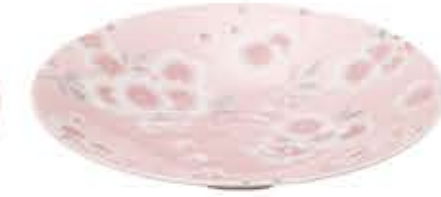
011230 8.0寸深皿 Φ24.5XH4.6cm 554g