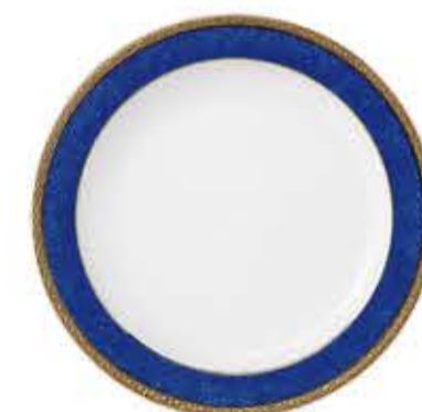
000748 10吋ミート Φ27.3.7XH3cm 790g