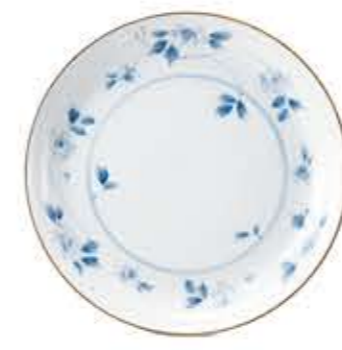
011536 8.0寸皿 φ25×H2.9cm 470g