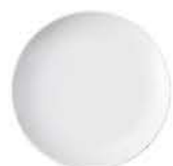
004168 6 1/4メタ皿 Φ16XH2.1cm 187g