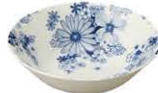
005890 5.5寸鉢 Φ17XH5cm 285g