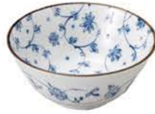
004018 4.8寸多用井 Φ15.2XH6.7cm 290g