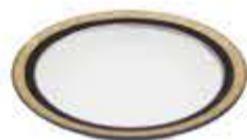
012038 51/2フルーツ Φ15.1XH3.1cm 183g