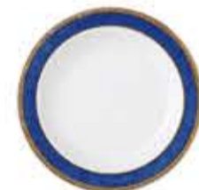
003247 6吋パン皿 Φ16XH2cm 210g