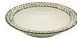
002905 51/2フルーツ Φ15.1XH3.1cm 183g