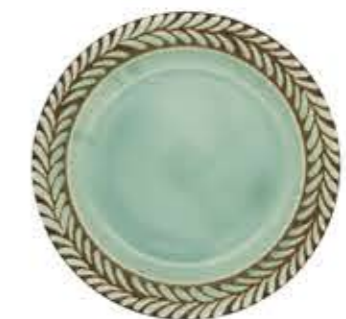
012635 7 1/2ケーキ Φ19.6XH2.2cm 294g