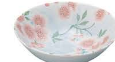
005923 5.5寸鉢 Φ17XH5cm 285g