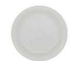
001414 5プチ皿 Φ12.2XH1.6cm 91g