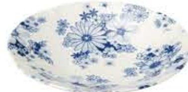
009820 7.0寸深皿 Φ22.3XH4cm 450g