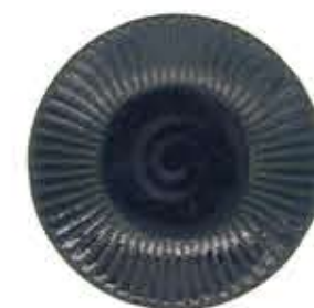
013044 5.0寸皿 Φ16.5XH2.3cm 198g