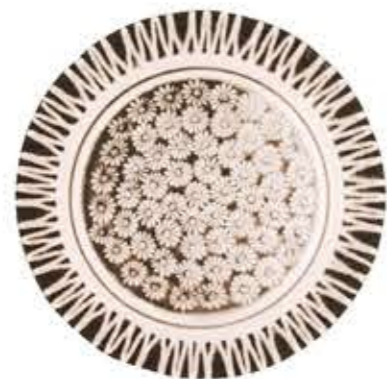
012791 8.0寸皿 Φ24.7XH3cm 541g