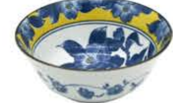
003997 4.8寸多用井 Φ15.2XH6.7cm 290g