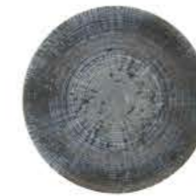
010366 5寸皿 Φ17XH2cm 145g