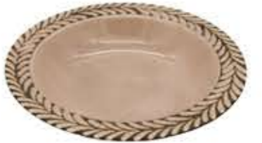
012642 8吋スープ Φ21XH4.2cm 364g