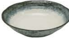
006532 5.5寸浅鉢 Φ16.5XH4cm 276g