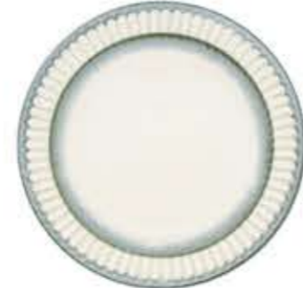
010783 9吋ミト Φ23.7XH2.8cm 515g