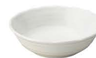
007804 7寸鉢 Φ21.6XH6.5cm 516g