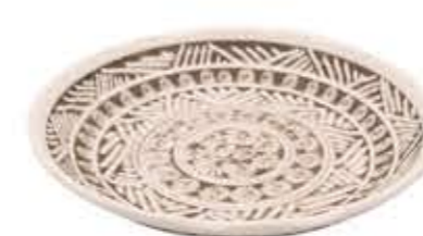
012786 7.0寸深皿 Φ22XH4cm 435g