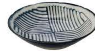
006250 5.5寸浅鉢 Φ16.5XH4cm 276g