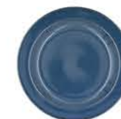
012844 6吋パン皿 Φ16XH2cm 210g