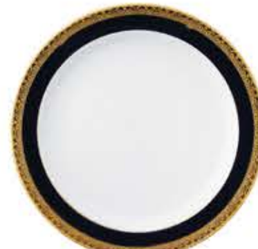
012032 10吋ミート Φ27.3.7XH3cm 790g