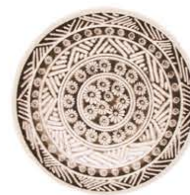
012787 8.0寸皿 Φ24.7XH3cm 541g