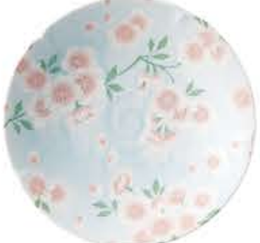
011887 8.0寸皿 Φ24.4XH3cm 535g