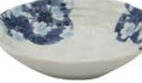
006418 5.5寸浅鉢 Φ16.5XH4cm 276g