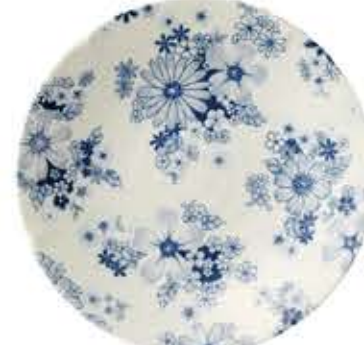
011857 8.0寸皿 Φ24.4XH3cm 535g