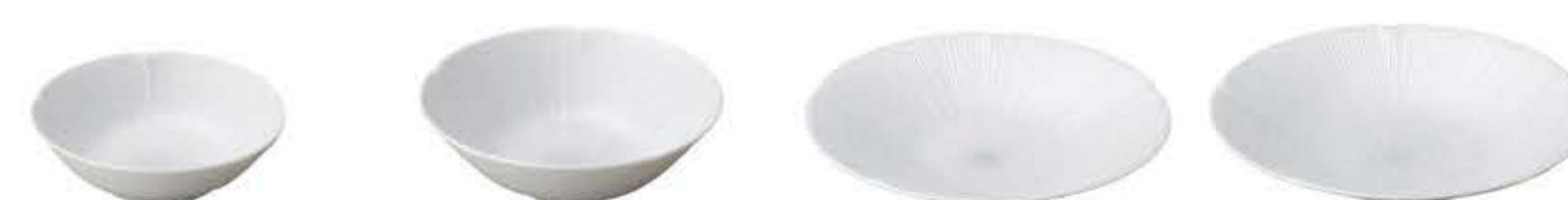
002596 4.5寸小鉢 Φ14XH4.1cm 189g 005914 5.5寸鉢 Φ17XH5cm 285g 009862 7.0寸深皿 Φ22.3XH4cm 450g 011212 8.0寸深皿 Φ24.5XH4.1cm 189g