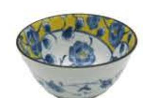
001030 3.8多用井 Φ12XH6.4cm 195g