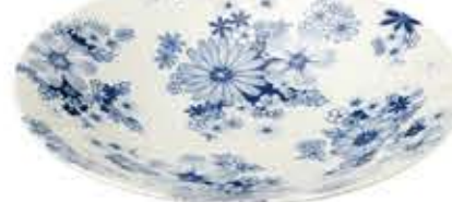
011191 8.0寸深皿 Φ24.5XH4.6cm 554g