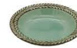
012632 51/2フルーツ Φ15.1XH3.1cm 183g