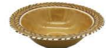
012143 6 1/2オートミル Φ17.2XH5.4cm 269g