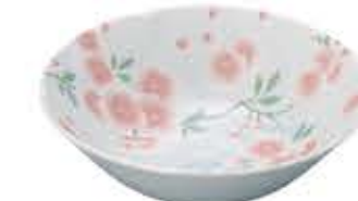
002605 4.5寸小鉢 Φ14XH4.1cm 189g