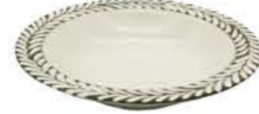
007609 8吋スープ Φ21XH4.2cm 364g