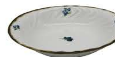
012106 9吋ペーカー 24X21.7XH4.5cm 485g