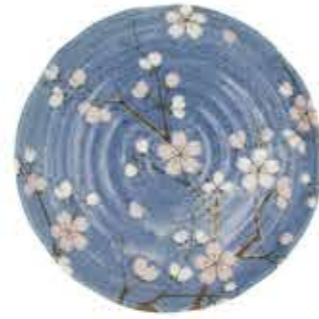
010198 7.0寸皿 Φ21.6XH2.5cm 435g