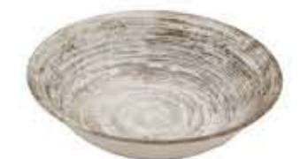
013073 5.5寸丼 Φ17XH5cm 208g