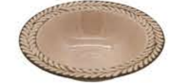
012640 6 1/2オートミル Φ17.2XH5.4cm 269g