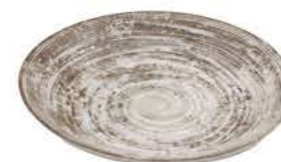
013074 7寸深皿 Φ22XH4cm 294g