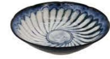
005899 5.5寸鉢 Φ17XH5cm 285g