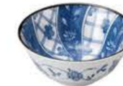
001042 3.8多用井 Φ12XH6.4cm 195g