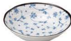
006481 5.5寸浅鉢 Φ16.5XH4cm 276g