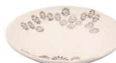
012794 7.0寸深皿 Φ22XH4cm 435g