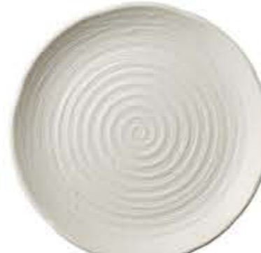
000655 9.7寸大皿 φ29.7×H3.3cm 963g