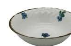
012102 6 1/2オートミル Φ16.6XH5cm 263g