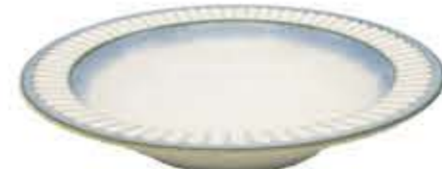
007594 8.0吋スープ Φ17.2XH5.4cm 269g