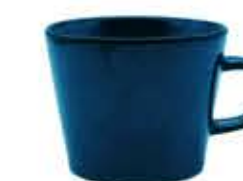
013096 切立マグ Φ10.5XH8.8cm 324g 370cc