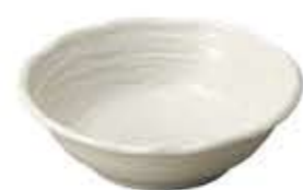
002251 4.5寸小鉢 φ13.9×H4.1cm 180g