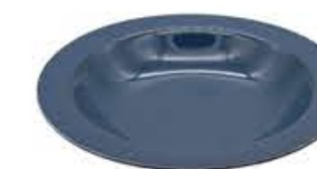
012848 8吋スープ Φ21XH4.2cm 364g