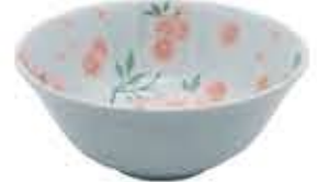
001909 4.0多用井 Φ14XH6.7cm 225g