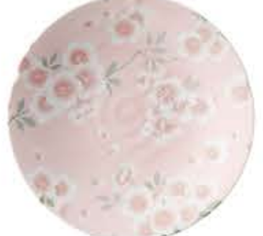
011896 8.0寸皿 Φ24.4XH3cm 535g