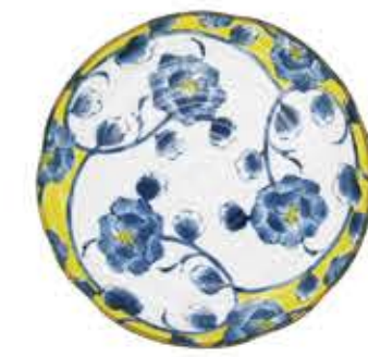
010138 7.0寸皿 Φ21.6XH2.5cm 435g