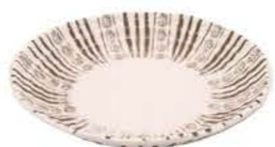
012798 7.0寸深皿 Φ22XH4cm 435g