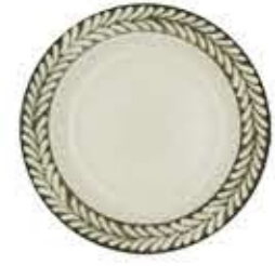
003334 6吋パン皿 Φ16XH2cm 210g