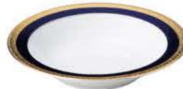
012034 8吋スープ Φ21XH4.2cm 364g