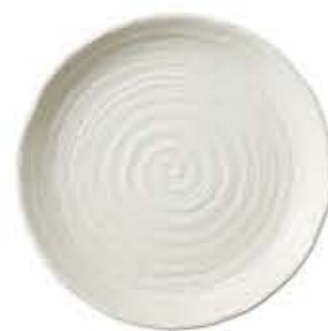
011689 8.0寸皿 φ24.7×H3cm 541g