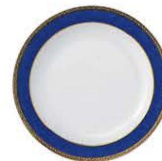
010699 9吋ミート Φ23.7XH2.8cm 515g