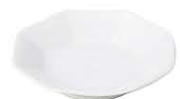
007282 7 1/2八角皿 19.5X18.9XH2.2cm 355g