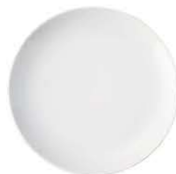
010945 9 1/4メタ皿 Φ23.8XH2.6cm 483g