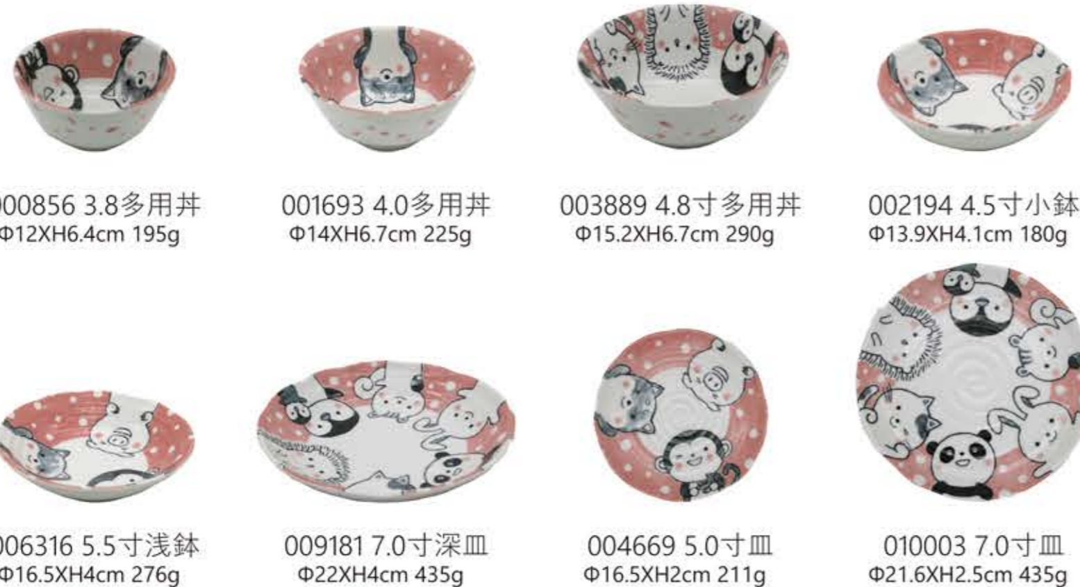
000856 3.8多用井 φ12XH6.4cm 195g