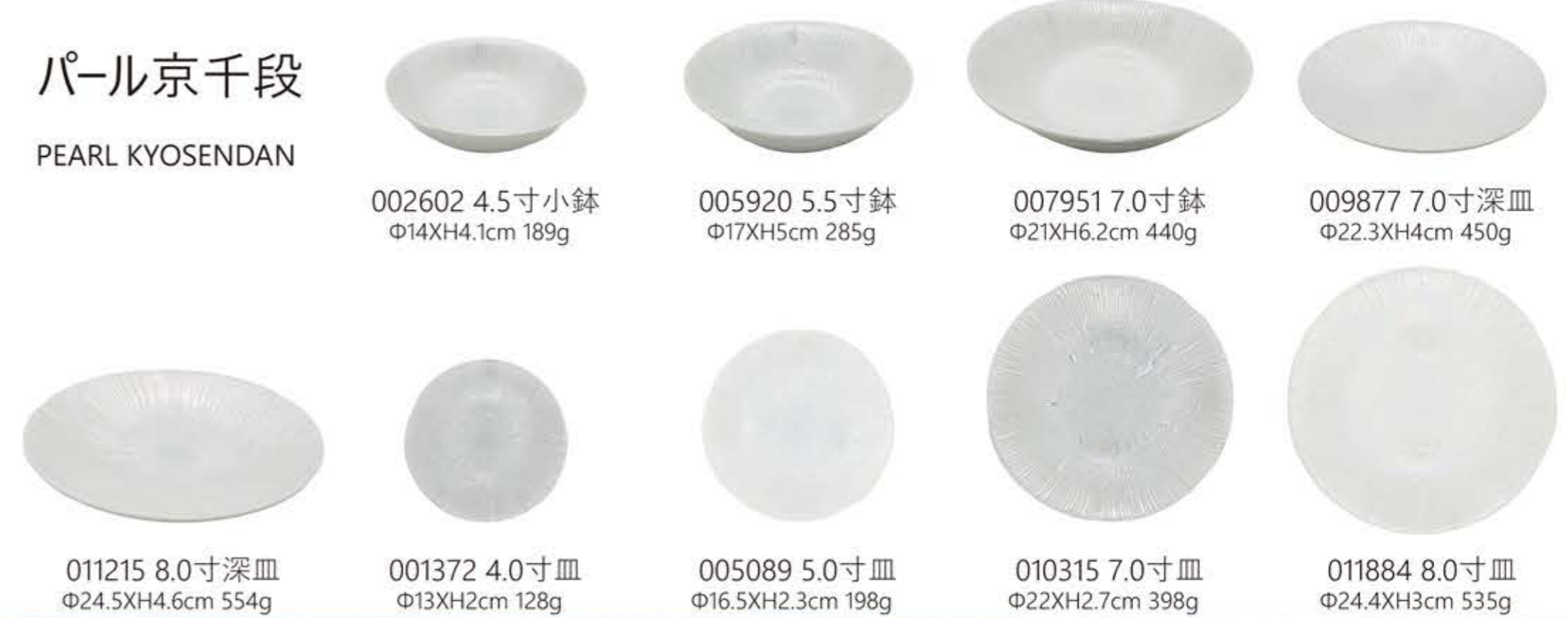
002602 4.5寸小鉢 φ14XH4.1cm 189g