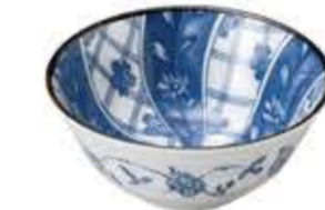
001858 4.0多用井 Φ14XH6.7cm 225g