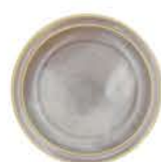
012389 4.0寸皿 Φ14.1XH1.9cm 124g