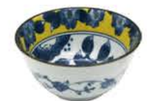
001021 3.8多用井 Φ12XH6.4cm 195g