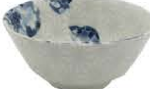
001792 4.0多用井 Φ14XH6.7cm 225g