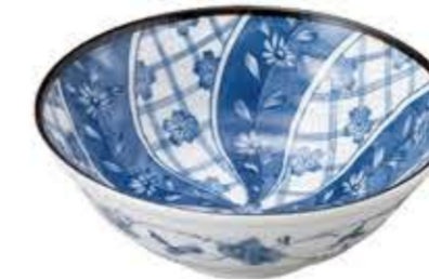
000181 6.8寸麵鉢 Φ21XH7.8cm 531g