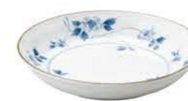
008953 7.0寸深皿 φ22.4×H4cm 420g