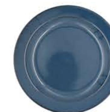
012846 9吋ミート Φ23.7XH2.8cm 515g