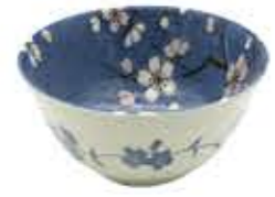
001138 3.8多用丼 Φ12XH6.4cm 195g