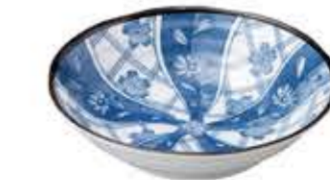
006475 5.5寸浅鉢 Φ16.5XH4cm 276g