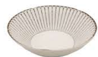
013053 5.5寸鉢 Φ17XH5cm 285g