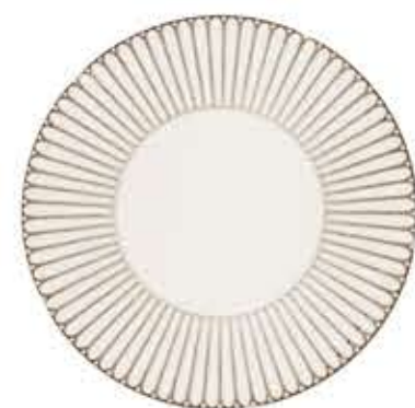
013055 8.0寸皿 Φ24.4XH3cm 535g