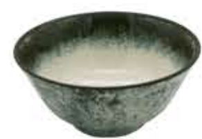
001939 4.0多用井 Φ14XH6.7cm 225g