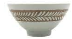
012851 大平 Φ12.7XH6.4cm 171g