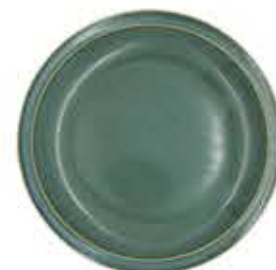
012071 5.0寸皿 Φ16.4XH2.1cm 174g