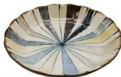
011146 8.0寸深皿 φ23.6×H5cm 552g