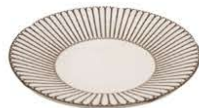
013054 7.0寸深皿 Φ22.3XH4cm 450g