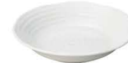
011068 8.0寸深皿 Φ23.6XH4.7cm 525g