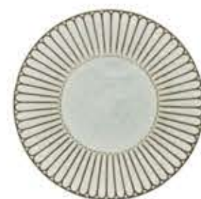
013048 5.0寸皿 Φ16.5XH2.3cm 198g