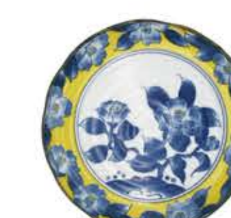
010132 7.0寸皿 Φ21.6XH2.5cm 435g