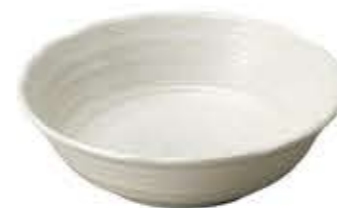
007813 7.0寸鉢 21.6×H6.5cm 516g