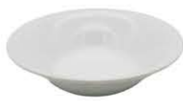
008212 8 1/2スープ Φ21.4XH3.7cm 363g