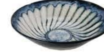
006247 5.5寸浅鉢 Φ16.5XH4cm 276g