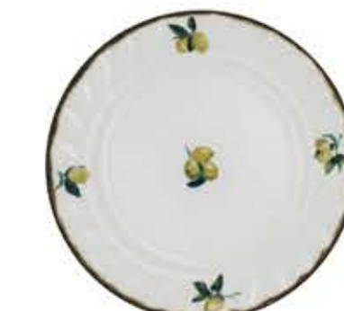
012099 9吋ミート Φ23.4XH2.5cm 480g