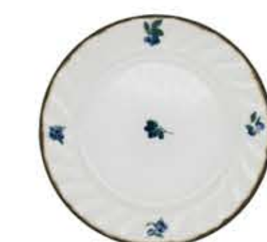
012105 9吋ミート Φ23.4XH2.5cm 480g