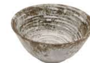
013071 4.8多用丼 Φ15.2XH6.7cm 290g