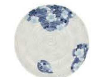
004735 5.0寸皿 Φ16.5XH2cm 211g