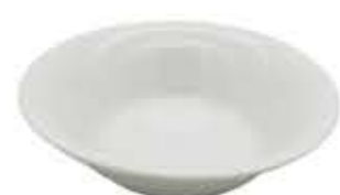
005959 6 1/2オートミル Φ16.4XH4.8cm 223g