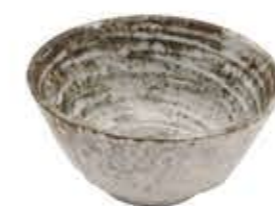
013070 3.8多用丼 Φ12XH6.4cm 195g