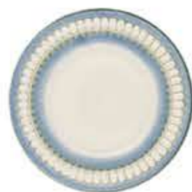
003325 6吋パン皿 Φ16XH2cm 210g