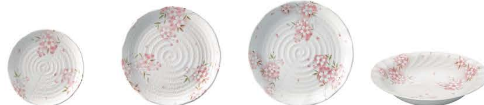
004705 5.0寸皿 Φ16.5XH2cm 211g 010057 7.0寸皿 Φ21.6XH2.5cm 435g 011671 8.0寸皿 Φ24.7XH3cm 541g 011026 9吋ペーカ Φ24X21.7XH4.5m 485g