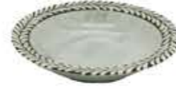
002902 51/2フルーツ Φ15.1XH3.1cm 183g