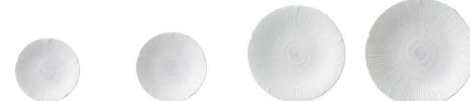
001369 4.0寸皿 Φ13XH2cm 128g 005080 5.0寸皿 Φ16.5XH2.3cm 198g 010312 7.0寸皿 Φ22XH2.7cm 398g 011878 8.0寸皿 Φ24.4XH3cm 535g