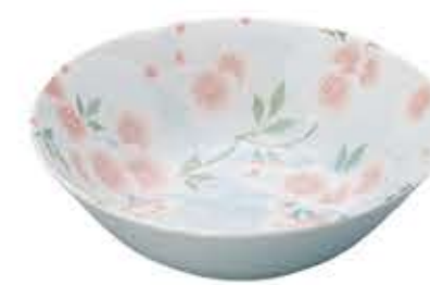
007954 7.0寸鉢 Φ21XH6.2cm 440g