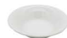
002677 5ボール Φ13.9XH3.7cm 148g