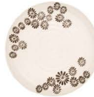
012795 8.0寸皿 Φ24.7XH3cm 541g