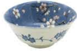
001942 4.0多用丼 Φ14XH6.7cm 225g