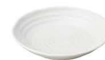
009352 7.0寸深皿 Φ22XH4cm 435g