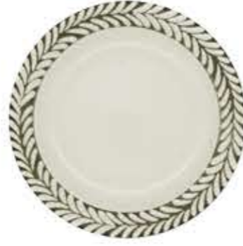
010792 9吋ミート Φ23.7XH2.8cm 515g