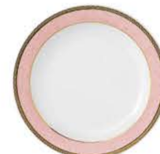
010693 9吋ミート Φ23.7XH2.8cm 515g