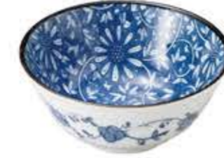
004021 4.8寸多用井 Φ15.2XH6.7cm 290g