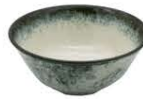
004084 4.8寸多用井 Φ15.2XH6.7cm 290g