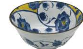
004006 4.8寸多用井 Φ15.2XH6.7cm 290g