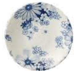
001354 4.0寸皿 Φ13XH2cm 128g