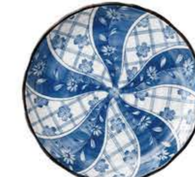
011725 8.0寸皿 Φ24.7XH3cm 541g