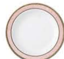
003241 6吋パン皿 Φ16XH2cm 210g