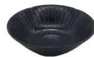
013045 5.5寸鉢 Φ17XH5cm 285g