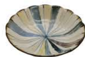
006649 5.5寸浅鉢 φ17cm×H4.3cm 279g