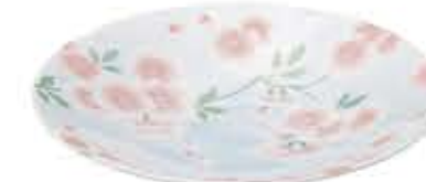
009886 7.0寸深皿 Φ22.3XH4cm 450g