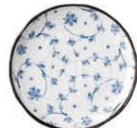
004798 5.0寸皿 Φ16.5XH2cm 211g