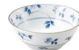
004208 5.3寸井 φ16.2×H6.5cm 237g