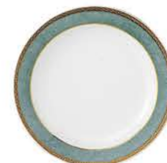
010696 9吋ミート Φ23.7XH2.8cm 515g