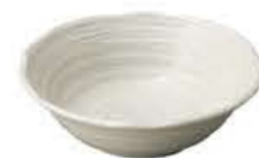
005584 5.5寸鉢 φ16.8×H5.1cm 282g