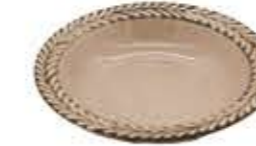
012638 51/2フルーツ Φ15.1XH3.1cm 183g