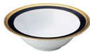
012036 6 1/2オートミル Φ17.2XH5.4cm 269g