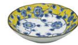
006460 5.5寸浅鉢 Φ16.5XH4cm 276g