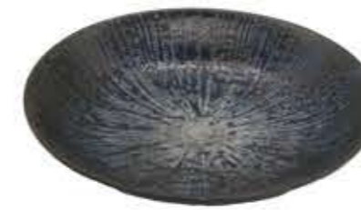
010368 7寸深皿 Φ22XH4cm 294g