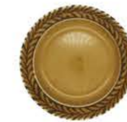
012142 6吋パン皿 Φ16XH2cm 210g