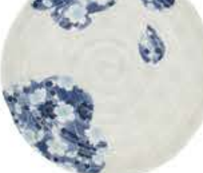
010099 7.0寸皿 Φ21.6XH2.5cm 435g