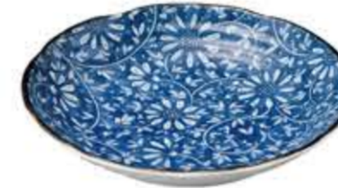
009424 7.0寸深皿 Φ22XH4cm 435g