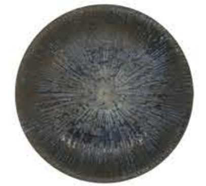
010369 8寸皿 Φ25XH3.5cm 392g