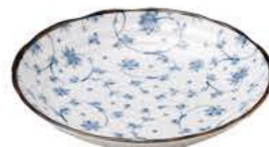
009421 7.0寸深皿 Φ22XH4cm 435g