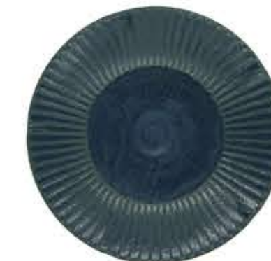
013047 8.0寸皿 Φ24.4XH3cm 535g