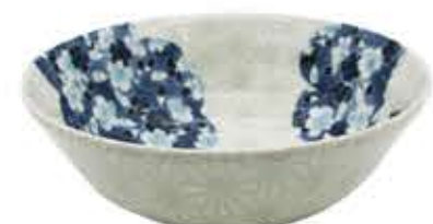
012623 6.8寸麵鉢 Φ21XH7.8cm 531g