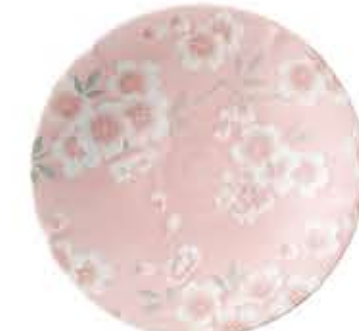
010321 7.0寸皿 Φ22XH2.7cm 398g