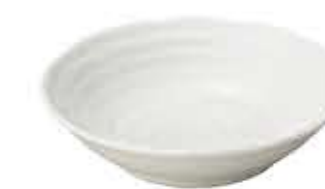
006436 5.5寸浅鉢 Φ16.5XH4cm 276g