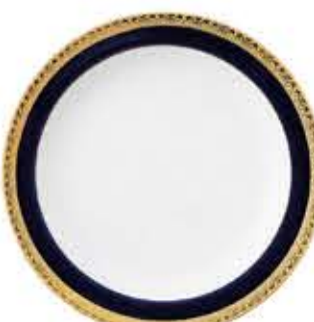
012033 9吋ミート Φ23.7XH2.8cm 515g