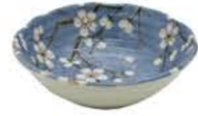
002320 4.5寸小鉢 Φ13.9XH4.1cm 180g