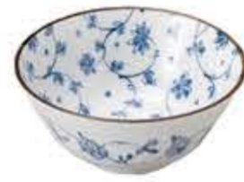
001864 4.0多用井 Φ14XH6.7cm 225g