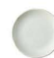
001297 4.0寸皿 Φ13.9XH1.9cm 133g