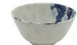
000973 3.8多用井 Φ12XH6.4cm 195g