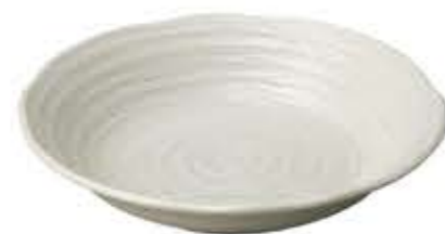
011074 8.0寸深皿 φ23.6×H4.7cm 525g