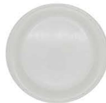
010864 9吋ミート Φ23.4XH2.5cm 470g