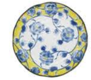
004786 5.0寸皿 Φ16.5XH2cm 211g