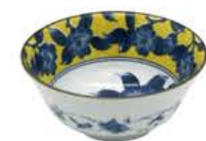
001849 4.0多用井 Φ14XH6.7cm 225g