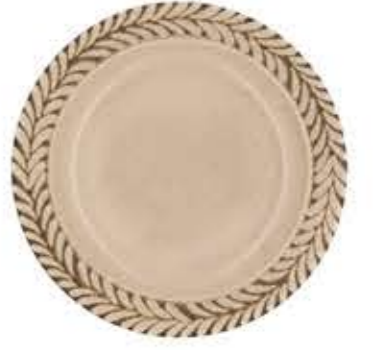
012643 9吋ミート Φ23.7XH2.8cm 515g