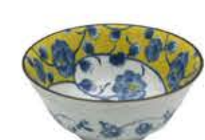
001852 4.0多用井 Φ14XH6.7cm 225g