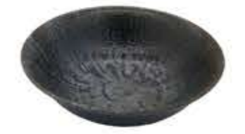
010367 5.5寸丼 Φ17XH5cm 208g