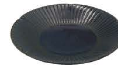
013046 7.0寸深皿 Φ22.3XH4cm 450g