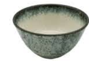
001135 3.8多用井 Φ12XH6.4cm 195g