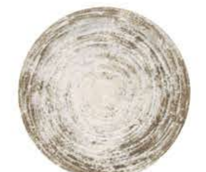
013075 8寸皿 Φ25XH3.5cm 392g