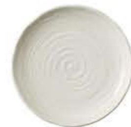
004759 5.0寸皿 φ16.5×H2cm 211g