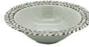
005410 6 1/2オートミル Φ17.2XH5.4cm 269g