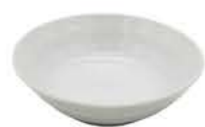
001951 4.5小鉢 Φ13.4XH4.2cm 144g