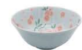
001102 3.8多用井 Φ12XH6.4cm 195g