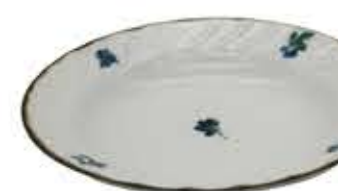
012104 8吋スープ Φ20.9XH4.2cm 357g