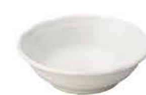
002242 4.5寸小鉢 Φ13.9XH4.1cm 180g