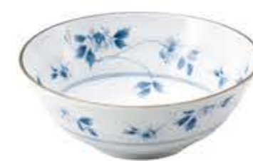
000043 6.8麵鉢 φ21×H7.7cm 380g