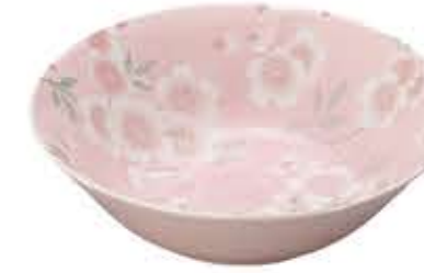
007966 7.0寸鉢 Φ21XH6.2cm 440g