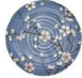
004852 5.0寸皿 Φ16.5XH2cm 211g