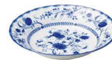
007342 8吋スープ φ20.9×H4.2cm 357g