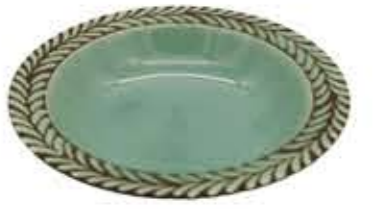
012636 8吋スープ Φ21XH4.2cm 364g