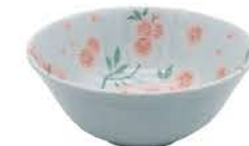
004063 4.8寸多用井 Φ15.2XH6.7cm 290g