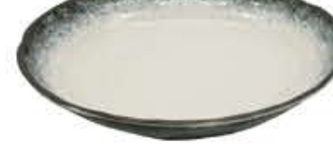
009502 7.0寸深皿 Φ22XH4cm 435g