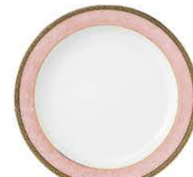
000742 10吋ミート Φ27.3.7XH3cm 790g