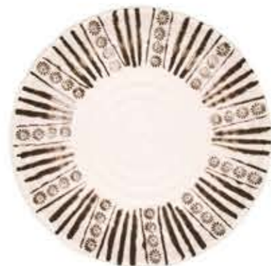
012799 8.0寸皿 Φ24.7XH3cm 541g