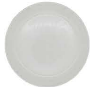
011458 8.0寸皿 Φ25XH2.9cm 470g