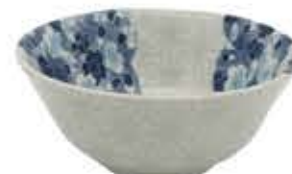
003970 4.8寸多用井 Φ15.2XH6.7cm 290g