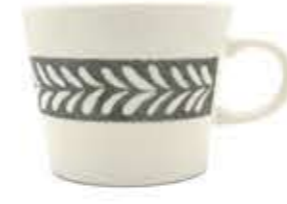
012004 切立マグ Φ10.5XH8.8cm 324g 370cc