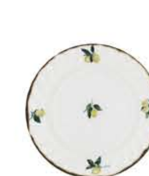
012095 6吋パン皿 Φ16XH1.9cm 176g