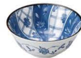
004012 4.8寸多用井 Φ15.2XH6.7cm 290g