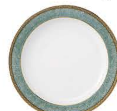
000745 10吋ミート Φ27.3.7XH3cm 790g