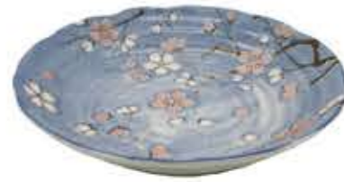
009505 7.0寸深皿 Φ22XH4cm 435g