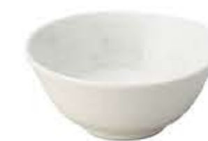
003979 4.8寸多用井 Φ15.2XH6.7cm 290g