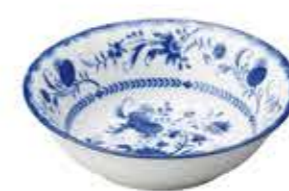
001585 5吋ボール φ13.4×H4.1cm 164g