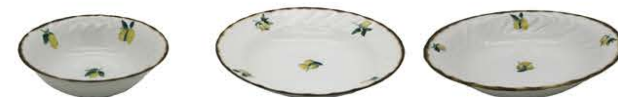
012096 6 1/2オートミル Φ16.6XH5cm 263g