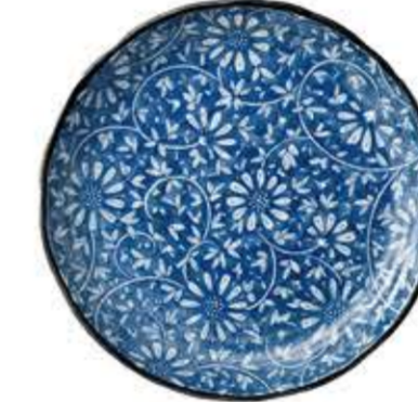
011734 8.0寸皿 Φ24.7XH3cm 541g