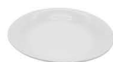
007978 8ボール Φ21.6XH6cm 403g