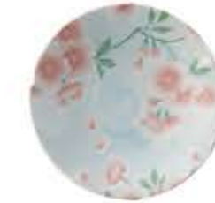
001375 4.0寸皿 Φ13XH2cm 128g