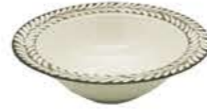
005413 6 1/2オートミル Φ17.2XH5.4cm 269g