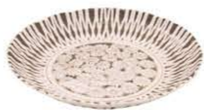
012790 7.0寸深皿 Φ22XH4cm 435g