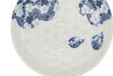
011677 8.0寸皿 Φ24.7XH3cm 541g