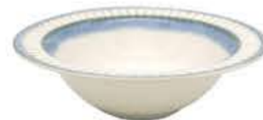
005404 6 1/2オトミル Φ17.2XH5.4cm 269g