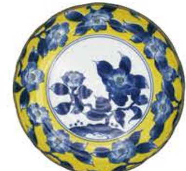
011713 8.0寸皿 Φ24.7XH3cm 541g