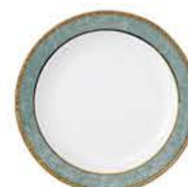
006850 7 1/2ケーキ Φ19.6XH2.2cm 294g