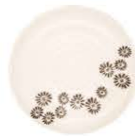
012792 5.0寸皿 Φ16.5XH2cm 211g