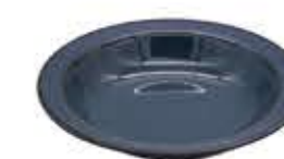
013058 51/2フルーツ Φ15.1XH3.1cm 183g