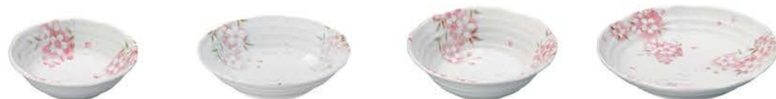
002224 4.5寸小鉢 Φ13.9XH4.1cm 180g 006349 5.5寸浅鉢 Φ16.5XH4cm 276g 005563 5.5寸鉢 Φ16.8XH5.1cm 282g 009253 7.0寸深皿 Φ22XH4cm 435g