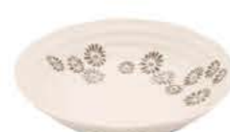
012793 5.5寸浅鉢 Φ16.5XH4cm 276g