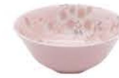
001129 3.8多用井 Φ12XH6.4cm 195g