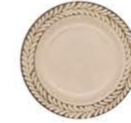
012639 6吋パン皿 Φ16XH2cm 210g