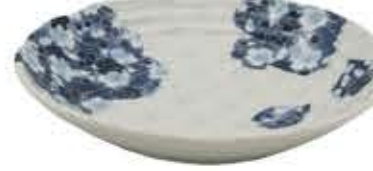
009334 7.0寸深皿 Φ22XH4cm 435g