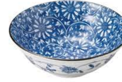
000190 6.8寸麵鉢 Φ21XH7.8cm 531g