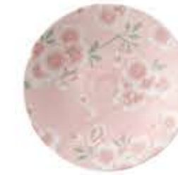
005107 5.0寸皿 Φ16.5XH2.3cm 198g