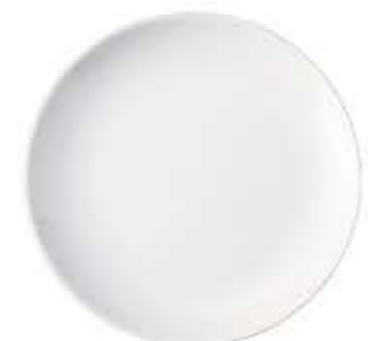
008029 8 1/8メタ皿 Φ20.6XH2.6cm 316g