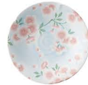
010318 7.0寸皿 Φ22XH2.7cm 398g