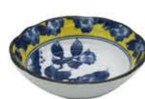
002272 4.5寸小鉢 Φ13.9XH4.1cm 180g