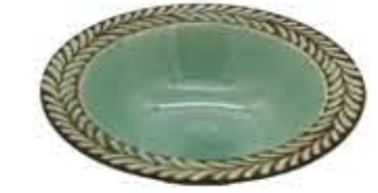
012634 6 1/2オートミル Φ17.2XH5.4cm 269g