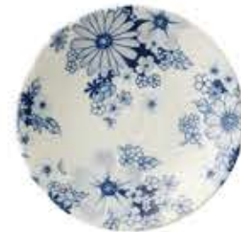
005062 5.0寸皿 Φ16.5XH2.3cm 198g