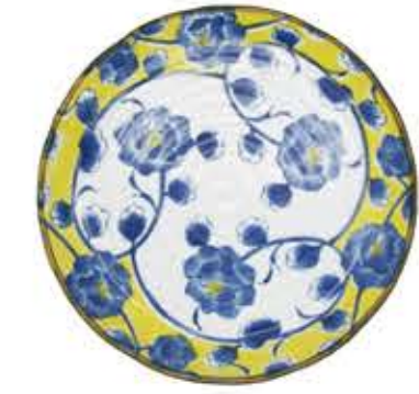
011719 8.0寸皿 Φ24.7XH3cm 541g