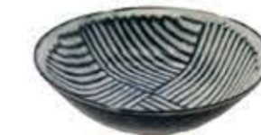
002584 4.5寸小鉢 Φ14XH4.1cm 189g