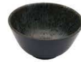
010364 3.8多用丼 Φ12XH6.4cm 195g