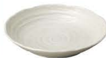
009364 7.0寸深皿 φ22×H4cm 435g