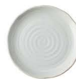
010105 7.0寸皿 Φ21.6XH2.5cm 435g