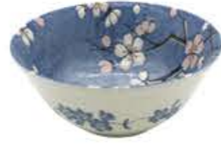
004087 4.8寸多用丼 Φ15.2XH6.7cm 290g