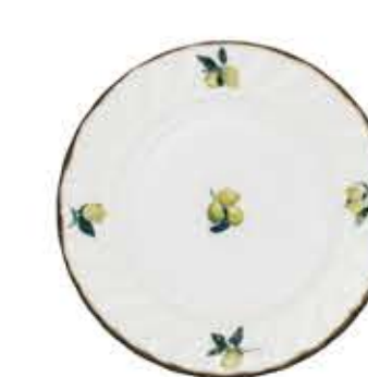
012097 7 1/2ケーキ Φ19.5XH2cm 275g