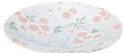
011218 8.0寸深皿 Φ24.5XH4.6cm 554g