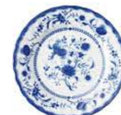
003088 6吋パン皿 φ16×H1.9cm 176g