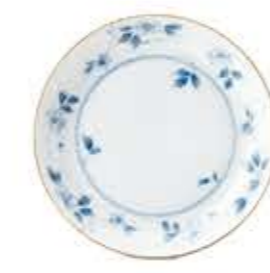
004546 5.0寸皿 φ15.5×H2.7cm 164g