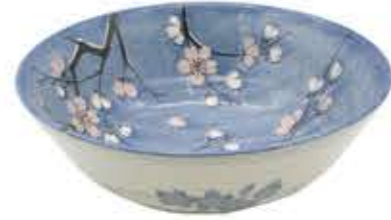
000250 6.8寸麵鉢 Φ21XH7.8cm 531g