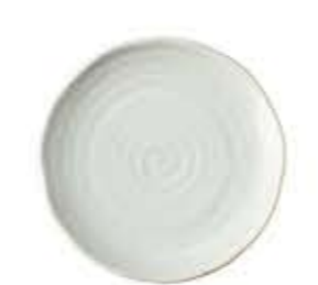
004753 5.0寸皿 Φ16.5XH2cm 211g