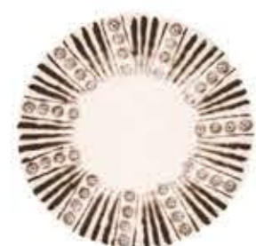
012796 5.0寸皿 Φ16.5XH2cm 211g