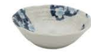
002239 4.5寸小鉢 Φ13.9XH4.1cm 180g