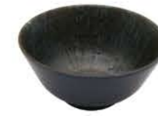
010365 4.8多用丼 Φ15.2XH6.7cm 290g