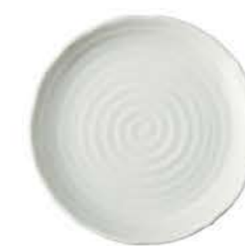
011680 8.0寸皿 Φ24.7XH3cm 541g