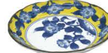
009391 7.0寸深皿 Φ22XH4cm 435g