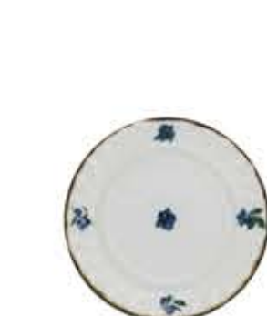
012101 6吋パン皿 Φ16XH1.9cm 176g