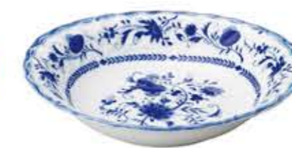
011005 9吋ペーカー 24×21.7×H4.5cm 485g