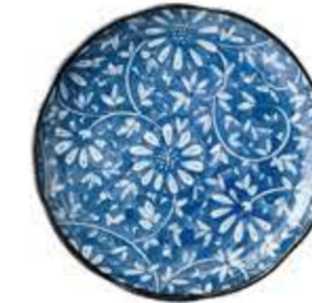
004801 5.0寸皿 Φ16.5XH2cm 211g