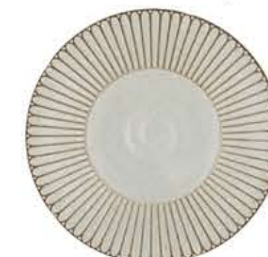
013051 8.0寸皿 Φ24.4XH3cm 535g