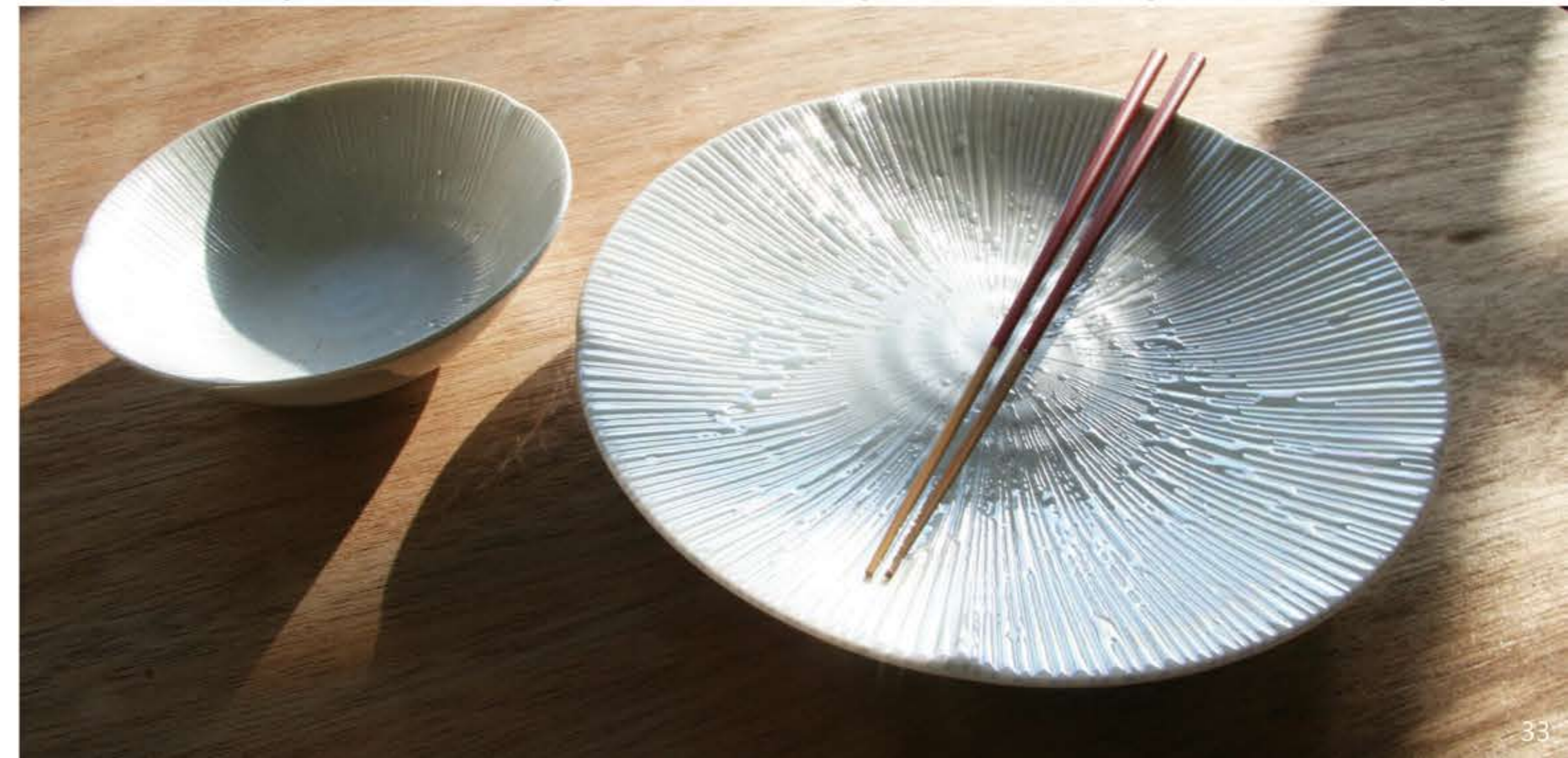
010003 7.0寸皿 φ21.6XH2.5cm 435g