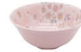
001933 4.0多用井 Φ14XH6.7cm 225g