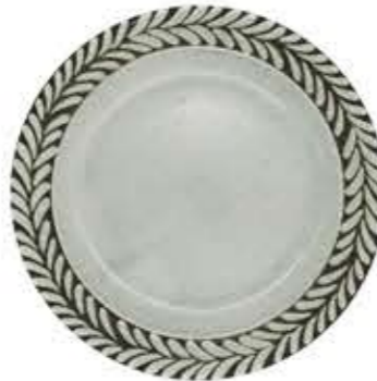
010789 9吋ミート Φ23.7XH2.8cm 515g