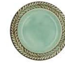
012633 6吋パン皿 Φ16XH2cm 210g