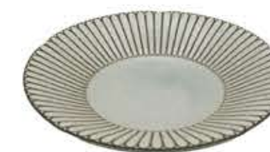
013050 7.0寸深皿 Φ22.3XH4cm 450g