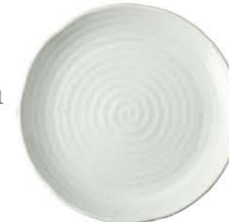
000649 9.7寸大皿 Φ29.7XH3.3cm 963g