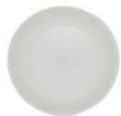
004420 5.0寸皿 Φ15.5XH2.7cm 164g