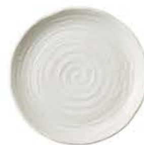
010111 7.0寸皿 φ21.6×H2.5cm 473g