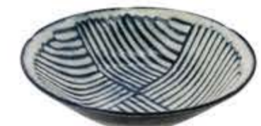
005902 5.5寸鉢 Φ17XH5cm 285g