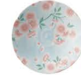
005092 5.0寸皿 Φ16.5XH2.3cm 198g