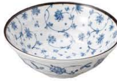
000187 6.8寸麵鉢 Φ21XH7.8cm 531g