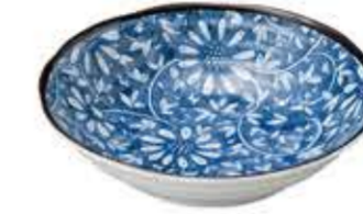
006484 5.5寸浅鉢 Φ16.5XH4cm 276g