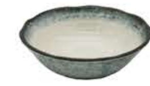
002317 4.5寸小鉢 Φ13.9XH4.1cm 180g