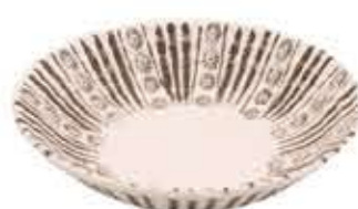
012797 5.5寸浅鉢 Φ16.5XH4cm 276g