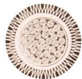
012788 5.0寸皿 Φ16.5XH2cm 211g