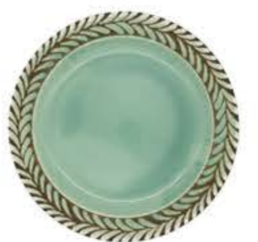
012637 9吋ミート Φ23.7XH2.8cm 515g